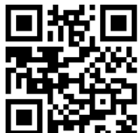
シニアサロン参加申込

◆申込先 [事務局] 西本企画 上石原3-57-123 Tel.090-8567-5161 井下企画 コスモ・ザ・パークス 403号 Tel.090-5823-1039 松澤14B長 センチュリーリバーサイド 302号 羽鳥顧問 多摩川2-1-7 ※アクアシティオ・メイツ調布様 真向い