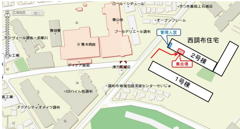
2号棟エントランス